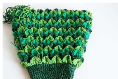
Blätterreihen, jede Runde in separater Farbe