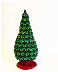
Stamm mit Standplatte an Bodenplatte des Weihnachtsbaumes fixiert

Die Metallic Pompons gleichmäßig verteilt auf dem Weihnachtsbaum festnähen.