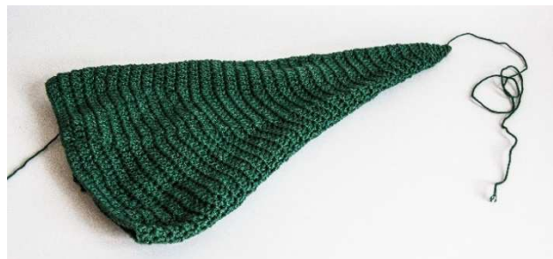
Kegel-Grundform für den Weihnachtsbaum

27. Rd.: 2 LM (als Ersatz für 1. Stb), 19 Stb = 20 M 28. Rd.: 2 LM (als Ersatz für 1. Stb), 1 Stb, 2 Stb zus.häkeln, (2 Stb, 2 Stb zus.häkeln) x 4 = 15 M 29. u. 30. Rd.: 2 LM (als Ersatz für 1. Stb), 14 Stb = 15 M 31. Rd.: 1 LM, (3 f M, 2 f M zus.häkeln) x 3 = 12 M 32. Rd.: 1 LM, 11 f M = 12 M 33. Rd.: 1 LM, (2 f M, 2 f M zus.häkeln) x 3 = 9 M Den Faden durch die äußeren M-Glieder der Runde ziehen, fest zusammenziehen und innen vernähen.