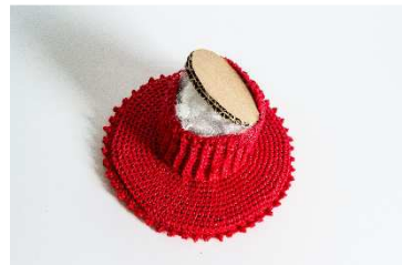
Stamm auf Standplatte festgenäht, mit Füllwatte gestopft und mit Pappscheibe gedeckelt