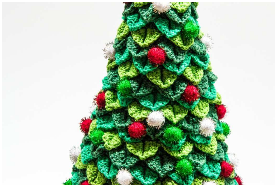
Metallic Pompons am Weihnachtsbaum fixiert

Die Metallic Pompons gleichmäßig verteilt auf dem Weihnachtsbaum festnähen.