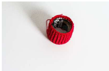
Stamm mit einer Innenrolle aus festerem Papier