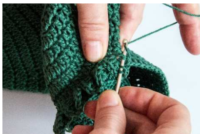
Stäbchen im 90 Grad Winkel um 1 Stb häkeln

Da ja die Grundform fortlaufend gemindert wird, werden die Blätter nicht grundlegend immer „auf Lücke“ gearbeitet werden können.