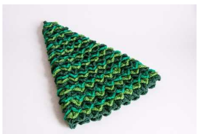
Alle Stäbchenrunden sind mit Blätter-Runden belegt.