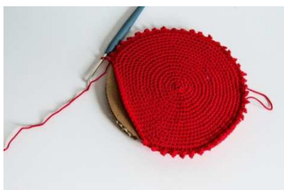
Standplatte für den Baum: 2 Bodenplatten zus.häkeln

Für den Stamm in rot 50 LM anschlagen und mit 1 Kettm. zur Runde schließen.