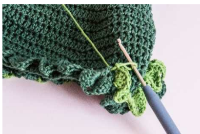
2. Blätter-Reihe in laub