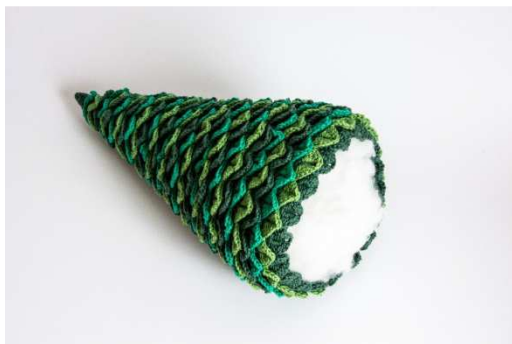
Weihnachtsbaum mit Füllwatte ausstopfen

Aus einem Wellpapp-Karton eine Scheibe mit 15 cm Durchmesser mit einem Cuttermesser ausschneiden und als Bodenplatte einsetzen.