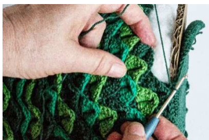
Pappscheibe mit der Bodenplatte an den Baum-Korpus häkeln

Die Pappscheibe einsetzen und die grüne Bodenplatte an den Kanten unter dem Weihnachtsbaum festhäkeln.