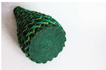
fertiger Baum mit Bodenplatte

Diese Bodenplatte noch 2 x in rot für den Standfuß des Baumes häkeln.